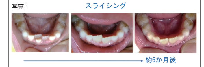
写真1のように乳歯の裏側から永久歯が生えてきてしまった場合、下の前歯のみに有効です。もちろんすべての子供に適用できるわけではありません。

ちなみにB、Cのような場合、永久歯が生えてくる準備ができていないということです。まずは歯科を受